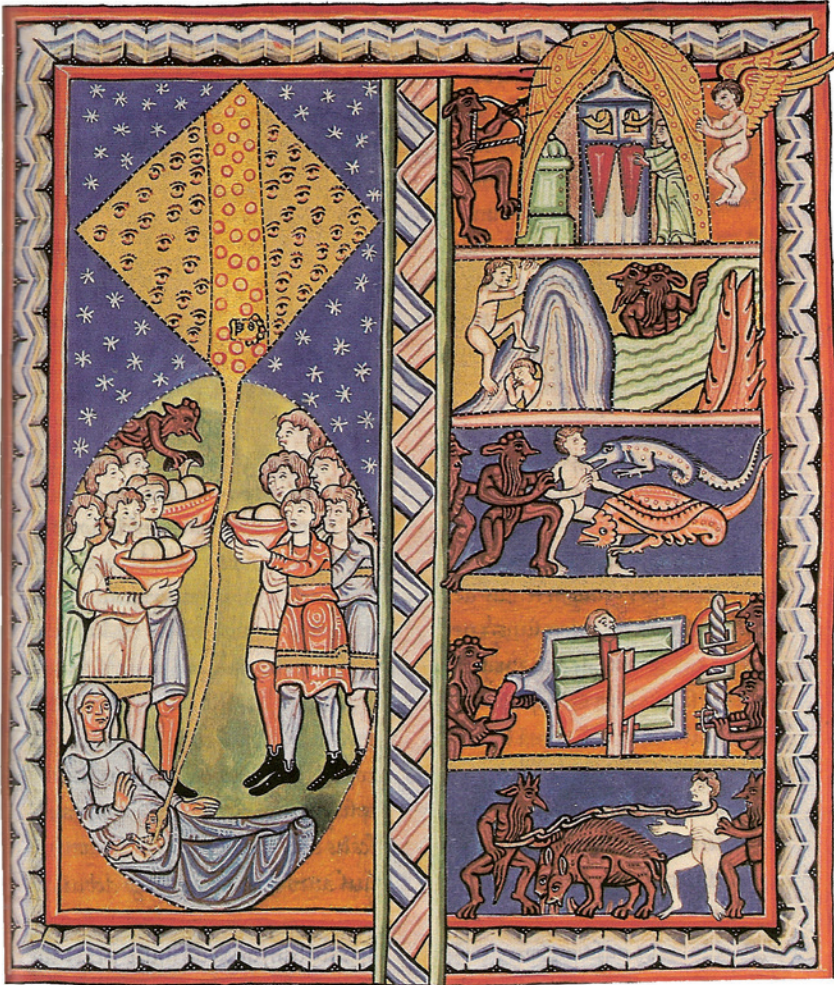
II. Figuur 2: Pelgrimstocht van de ziel (43,I,4)