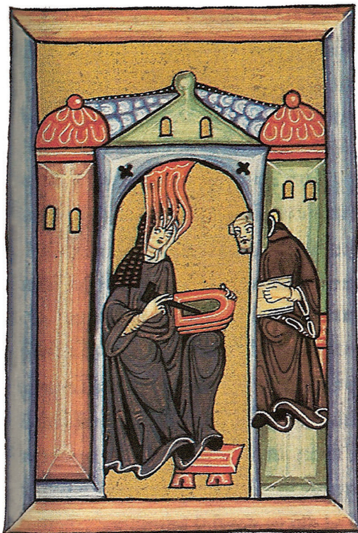
1. Figuur 1: Hildegard en Volmar (43,I,1)