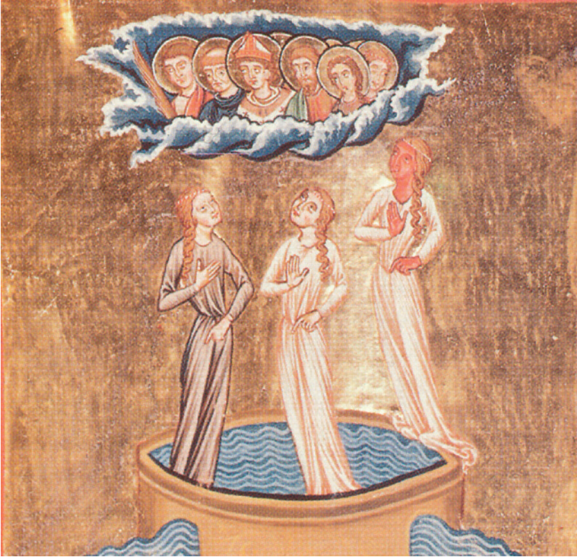
xii. Figuur 10: Liefde, Ootmoed en Vrede (fragment) (92,III,3)