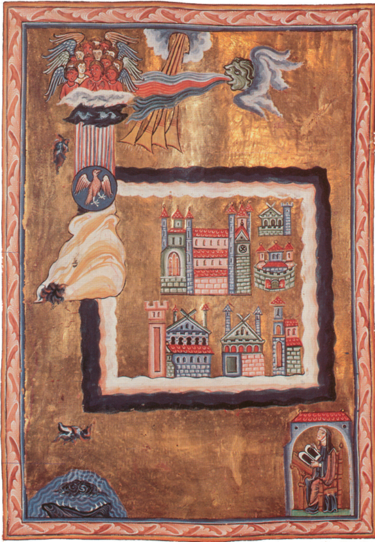
x. Figuur 8: De stad als metafoor voor de schepping (92,III,1)