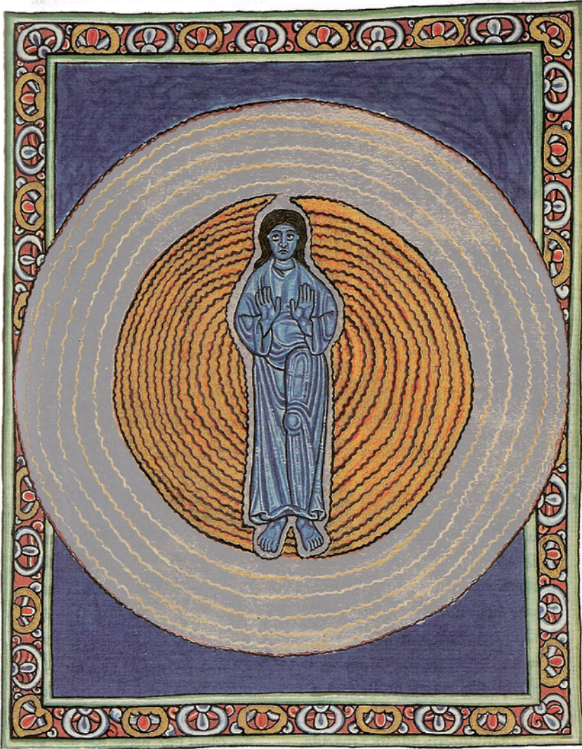
v. Figuur 3: De Drie-eenheid (43,II,3)