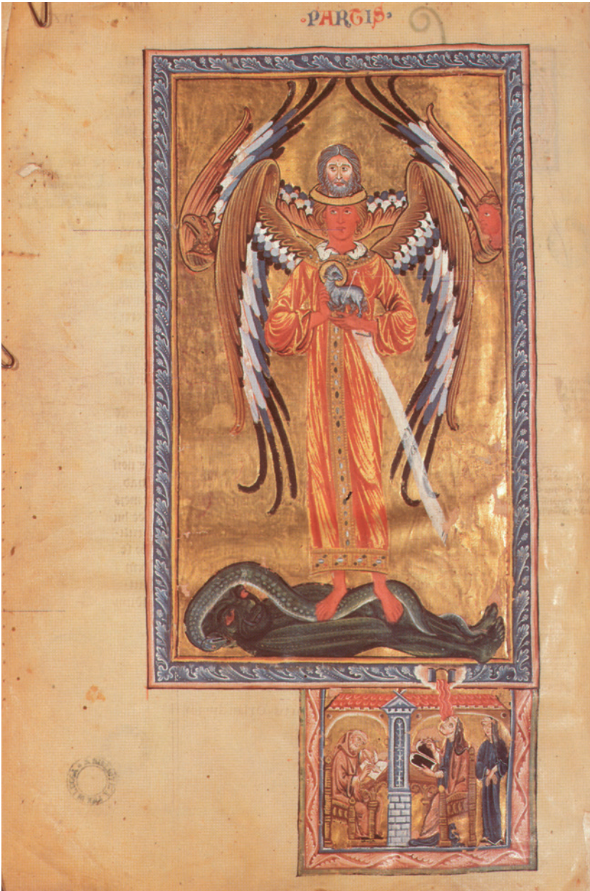
VIII. Figuur 6: De gevleugelde Drie-eenheid (92,1,1)