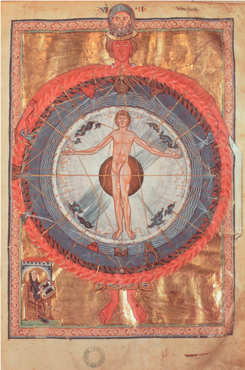
IX. Figuur 7: De mens in het centrum van de schepping (92,I,2)