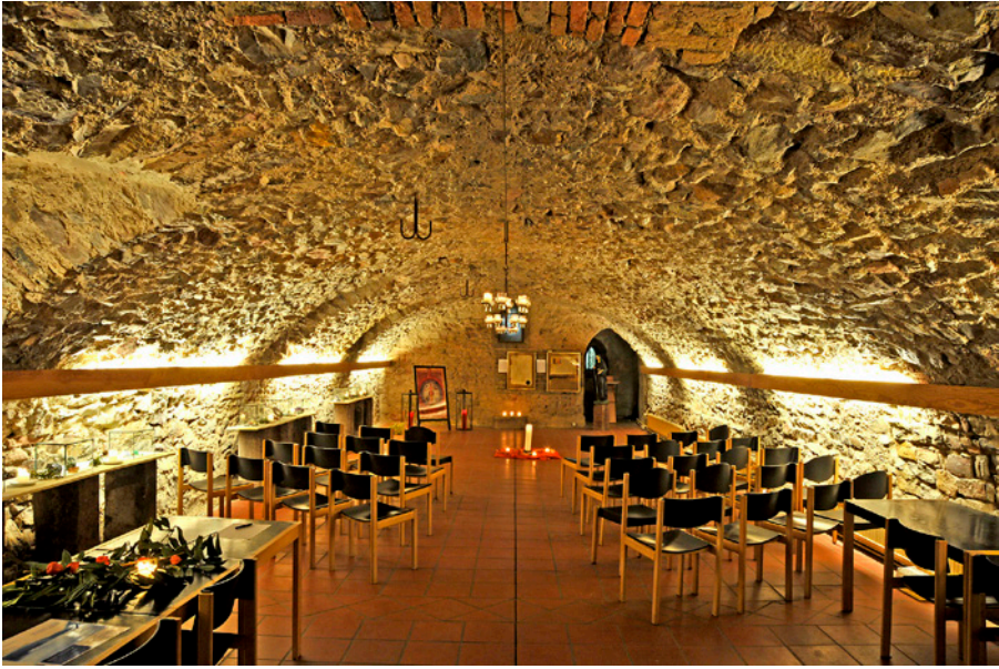
iv. Overgebleven gewelf klooster Rupertsberg