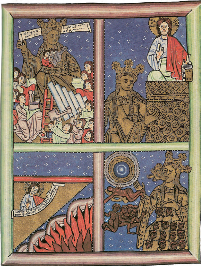
VII. Figuur 5: De H. Kerk (43,II,3)