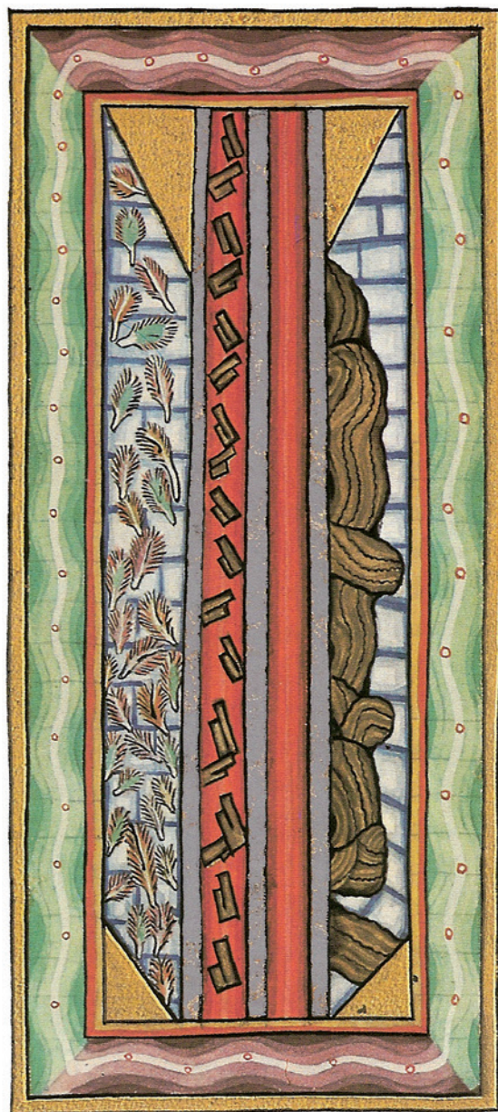
vi. Figuur 4: De rode driekantige zuil, metafoor voor de H. Drie-eenheid. (43A,III,7)